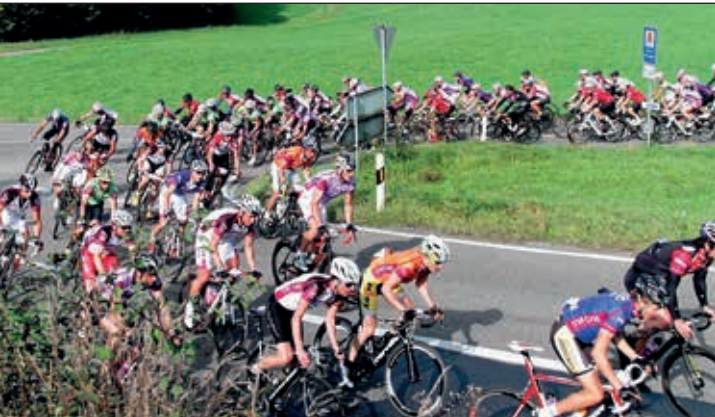
Tausend sportliche Radler waren schon bei der Lila Logistik Charity Bike Cup am Start.

Die Rundfahrt Lila Logistik Charity Bike Cup findet am 3. Oktober erstmals in Marbach statt