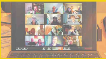
Marbach handelt! Video-meeting