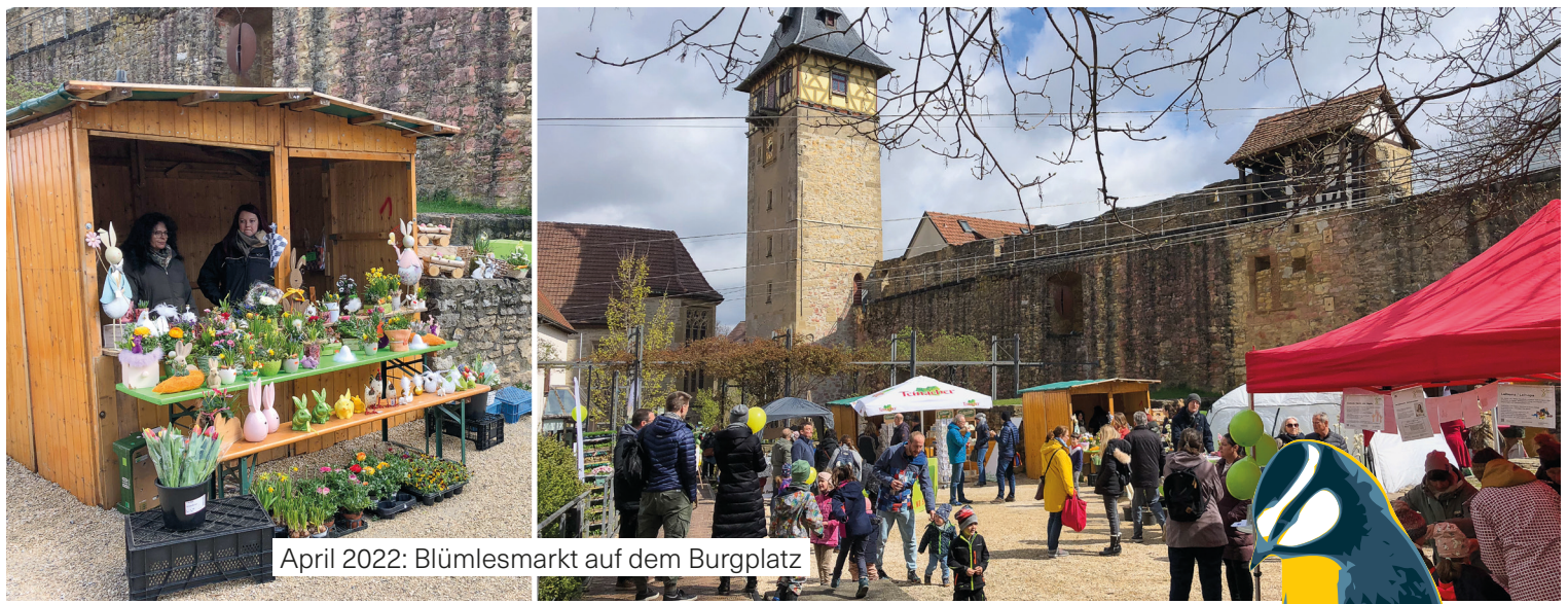
April 2022: Blümlermarkt auf dem Burgplatz