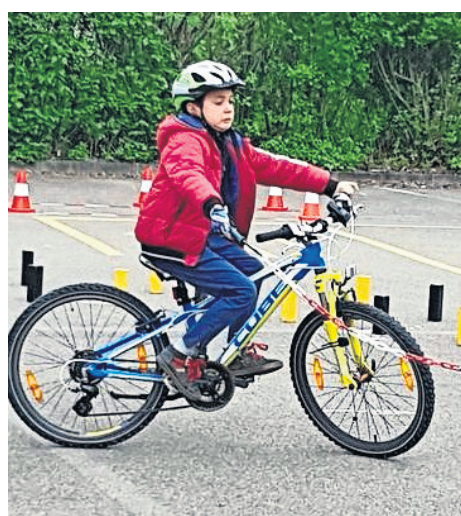
Beim Radfahren war höchste Konzentration angesagt.

sind und alles richtig funktioniert. Nach einer Begehung des Parcours ging es einzeln an den Start. Schon das Fahren über ein Brett war nicht ganz einfach. Einhändig, mit einer Kette in der freien Hand einen Kreis abfahren, verlangte höchste Konzentration. Anschließend ging es in den Linkskreis und eine enge Gasse. Spätestens beim Slalom und abschließenden Bremsstest war allen klar, dass in dem über 200 Meter langen Parcours enorme Geschicklichkeit gefordert war. Obwohl einige unfreiwillig absteigen mussten, waren alle mit Begeisterung dabei. Manche Schülerinnen und Schüler packte sogar der Ehrgeiz in der Freizeit weiter zu üben. Wunnensteinschule Großbottwar